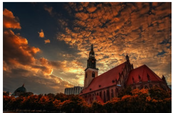
さばきは神の家から始まる

このようにして、キリストを拒み、死に渡したエルサレムの町の人々は、のちにさばきに渡されました。ローマにより、滅ぼされたのです。そして同じことが終末の背教の教会において再現するでしょう。その日、背教の教会はキリストをペテン師呼ばわりし、どこまでも忠実にキリストに従おうとする人々を訴えるようになります。そしてその教会に関して、「 神の家からさばきが来る 」とテキストのみことばは語っているのです。正しくこれらのことを理解し、必要な終末の備えを行いましょ。